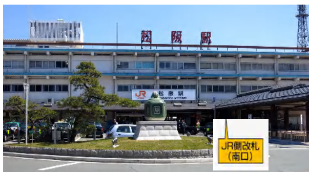
松阪市観光情報センター