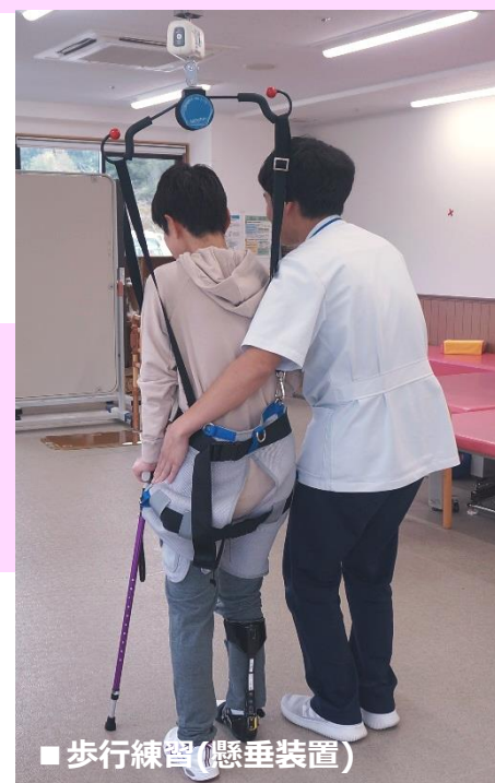
■歩行練習(懸垂装置)

骨折や術後は関節に負担がかからないように、徐々に体重をかけながら歩く練習を行います。また、脳血管疾患による後遺症の程度により、新しい歩行方法の獲得を目指します。歩行器や手すり、杖、装具などを利用して少しずつ歩ける範囲を広げていきます。