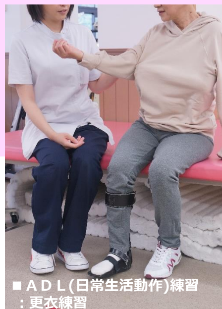
■ADL(日常生活動作)練習 ：更衣練習

在宅復帰へ向けて、個々に合わせたADL（日常生活動作）練習を取り入れ、家族さまに向けて適切な介助方法を学んでいただきます。必要な患者さまには、退院前にご自宅へ訪問して住宅改修のアドバイスをを行い、住みやすい環境づくりを目指します。