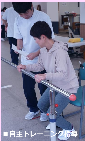
■ 自主トレーニング指導