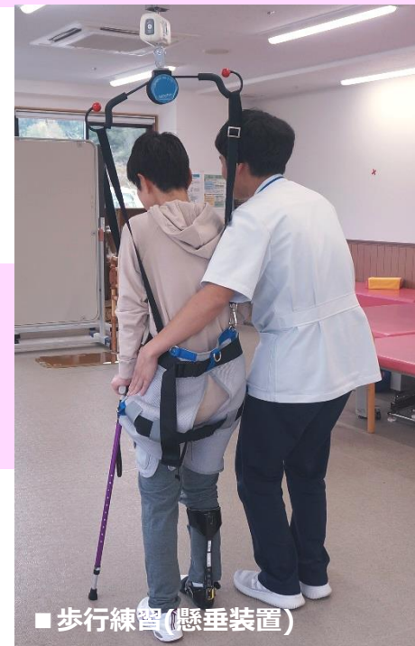
■ 歩行練習(懸垂装置)

骨折や術後は関節に負担がかからないように、徐々に体重をかけながら歩く練習を行います。また、脳血管疾患による後遺症の程度により、新しい歩行方法の獲得を目指します。歩行器や手すり、杖、装具などを利用して少しずつ歩ける範囲を広げていきます。