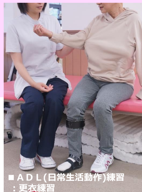
■ ADL(日常生活動作)練習 ：更衣練習

在宅復帰へ向けて、個々に合わせたADL（日常生活動作）練習を取り入れ、家族さまに向けて適切な介助方法を学んでいただきます。必要な患者さまには、退院前にご自宅へ訪問して住宅改修のアドバイスを行い、住みやすい環境づくりを目指します。